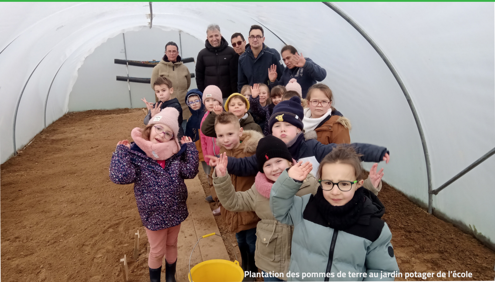
Plantation des pommes de terre au jardin potager de l'école