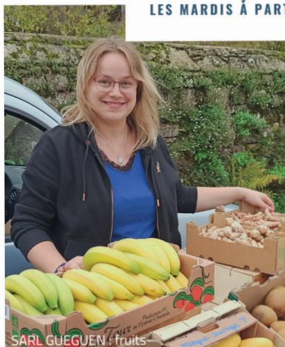
SARL GUEGUEN : fruits